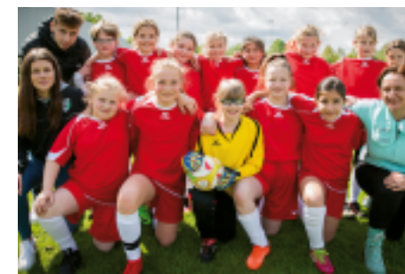
Kamen weiter: Paul-Schneider-Schule und die Grundschule am Kinderbach