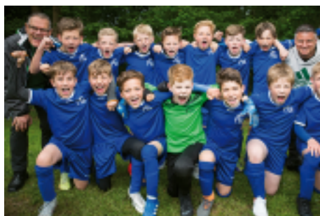
Qualifiziert: Ludgerusschule und Nikolaischule