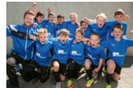
...ebenso wie die Marienschule bei den Älteren