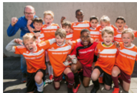
Qualifiziert für die Endrunde: Wartburgschule

Gievenbeck - Beim Vorrundenturnier des 1.FC Gievenbeck unter der qualifizierten Organistaion und Leitung von Patrick Hartung und seinem Team, lieferten sich die sechs Teams der Jüngeren spannende und enge Spiele, wobei sich letztlich die Wartburgschule ungeschlagen mit 19:1 Toren vor der Marienschule 2 und der Grundschule Sprakel durchsetzte. Bei den Älteren standen sich im Finale die Marienschule und die Michaelschule gegenüber. Mit 1:0 behielt die Marienschule 2 die Oberhand und fährt am 6. Juni zur Endrunde.