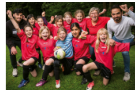
Kamen weiter: Davert- und Matthias-Claudius-Schule