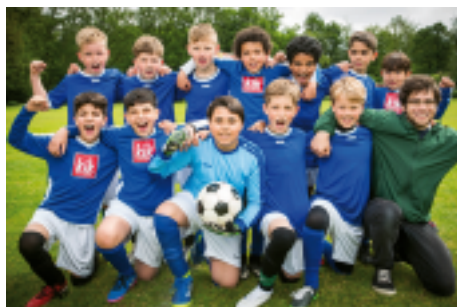
Die beiden Teams der Paul-Schneider-Schule