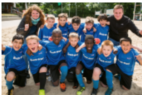
Beim Turnier bei BW Aasee erfolgreich: Peter-Wustschule bei den Jüngeren und die Hermannschule bei den Älteren

Overberg-Schule Stadtmeister 2006+2015 Paul-Gerhardt-Schule Stadtmeister 2004+2006 Peter-Wust-Schule Stadtmeister 2010